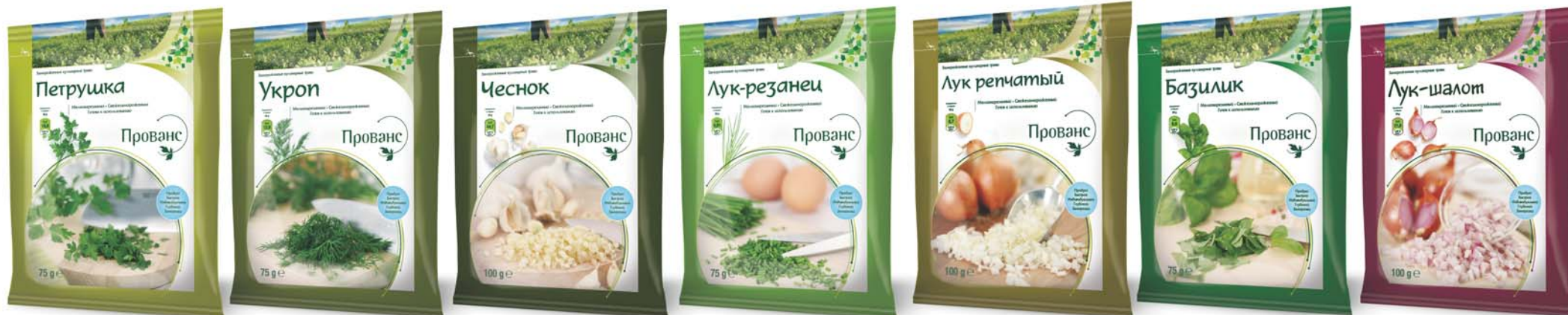
Петрушка "Прованс", 75 гр

Мелконарезанные, свежезамороженные травы в повторно закрывающейся упаковке.