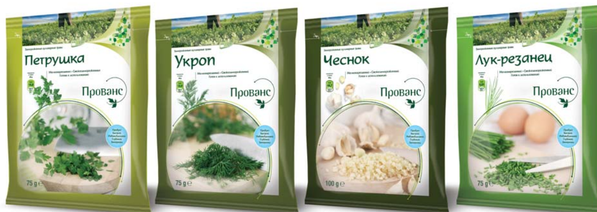
Petražolės «Provansas», 75 gr

Asortimentą sudaro išplautos, smulkiai supjaustytos ir birios aromatinės žolelės: