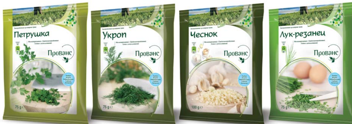
Pētersīļi «Provansa», 75 gr

Sortimentā ir mazgāti, smalki sagriezti un irdeni aromātiskie garšaugi: