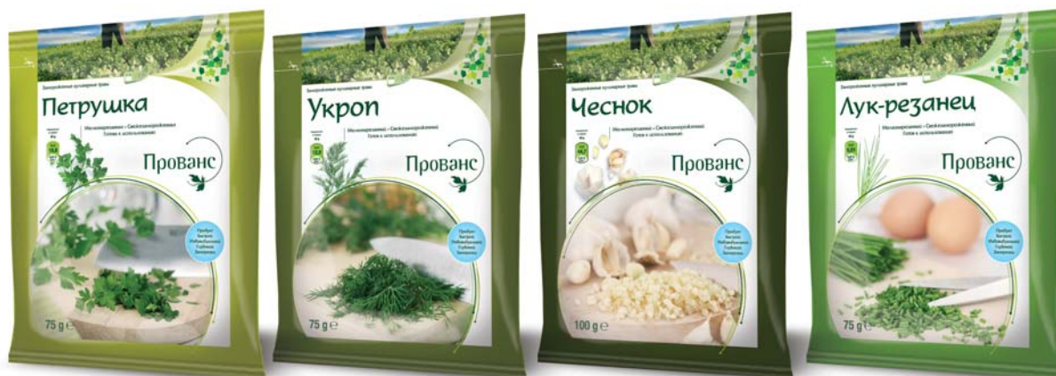
Петрушка «Прованс», 75 гр

У асортименті представлені промиті, дрібно нарізані та розсипчасті ароматні трави: