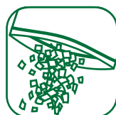
Kasutage sisust soovitav kogus