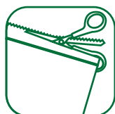
Avage pakend lõikejoone järgi